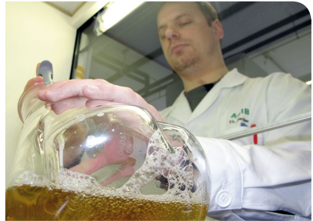
Dank der Forschungsleistungen des acib können Medikamentenwirkungen erstmalig im Reagenzglas simuliert werden

Den ForscherInnen des acib gelang es, erstmals die einzelnen Enzyme aus dem Abbauprozess zu isolieren. Nun kann man im Reagenzglas für jedes einzelne Enzym dessen Wirkung auf das Medikament analysieren. Dadurch ist es möglich, in einer frühen Entwicklungsphase eines neuen Medikaments/Wirkstoffs festzustellen, welche Abbauprodukte entstehen und welche Enzyme dafür verantwortlich sind. Darauf aufbauend lassen sich Abbauprodukte in großer Menge herstellen und weitere Untersuchungen durchführen. Unsicherheiten bezüglich der Wirkung werden beseitigt, denn im Reagenzglas werden genau jene Zwischenprodukte gebildet, die im Körper tatsächlich entstehen. Ungeeignete Medikamente können so in einem frühen Stadium ausgeschieden und geeignete schneller zur Marktreife geführt werden. Dies spart enorme Entwicklungskosten und sichert einen Vorsprung am Markt.